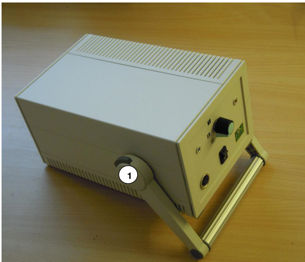
Slika 1: Namizna postavitve napajalne enote

Naprava je namenjena za namizno uporabo. Ročaj na napajalni enoti služi tudi kot podpora. Ročaj premaknemo tako, da istočasno pritisnemo pritisnemo siva gumba (1) na obeh straneh naprave in previdno premaknemo ročaj v nov položaj.