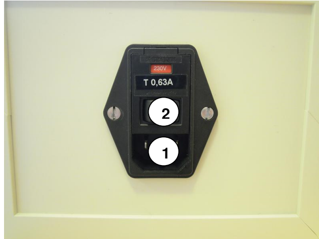
Slika 2: Vtičnica za priključitev napajanja

Omrežno napajalno napetost 230V priključimo preko standardne EURO vtičnice (1), ki se nahaja na zadnji strani napajalne enote. Na vtičnici se nahaja tudi stikalo za vklop (2).